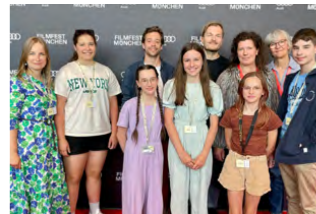
Filmfest München