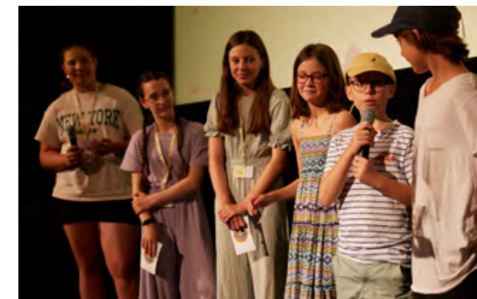
Filmfest München